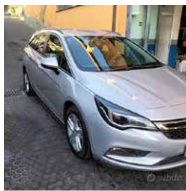
OPEL-ASTRA , CC.1.6, CDTI, ANNO 10.2017, SW, € 10.750,00 BUSCEMI AUTO TEL. 0933.51554

OPEL MOKKA , cc. 1.6, 130cv, pick-up, anno 01/2015, colore grigio, € 9.700,00 ALESSI & MESSINA TEL. 0933 / 22306 - 22068