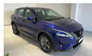
NISSAN QASHQAI III , CC. 1.3, BUSINESS, 158CV, ANNO 02.2023, € 24.890,00 FABIO CARS TEL. 0933.21630

TEL. 0933/28203 335/7491566 NISSAN JUKE I , cc. 1.5, dci, n-connetta, 110cv, colore nero, anno 05/2017, full opt, € 13.390,00 FABIO CARS TEL. 0933/21630