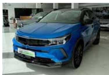
OPEL GRANDLAND , CC. 1.5, FUEL, GPL, ANNO 03.2021, € 18.950,00 ALESSI & MESSINA TEL. 0933 / 22306 - 22068

OPEL MOKKA , tagliandi regolari, km 60000, colore bianco, unico proprietario, benzina, anno 2016. Prezzo € 10.300,00 CELL. 3403924233