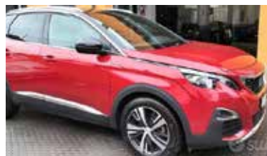
PEUGEOT 3008 , CC. 2.0, 150CV, BLUE HDI, ANNO 07.2018, € 18.500,00 BUSCEMI AUTO TEL. 0933.51554

PEUGEOT 3008 , cc. 1.5, blue, hdi, 130cv, colore grigio, anno 08/2018, € 17.900,00 ALESSI & MESSINA TEL. 0933 / 22306 - 22068