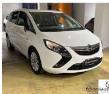
OPEL ZAFIRA , CC. 1.4, 140CV, GPL, COSMIO, ANNO 09.2014, € 7.800,00 ALESSI & MESSINA TEL. 0933 / 22306 - 22068

OPEL GRANDLAND , cc. 1.2, 130cv, colore rosso, anno 06/2022, full opt, € 19.290,00 FABIO CARS TEL. 0933/21630