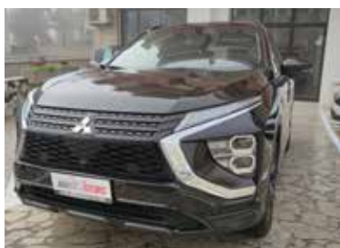
MITSUBISHI ECLIPSE CROSS , CC. 2.4, 98CV, ANNO 03.2022, € 36.800,00 AMATO MOTORS TEL. 0933/28203 335/7491566