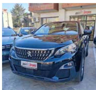
PEUGEOT 3008 II , CC.1.5, BLUE HDI, BUSINESS, 130CV, ANNO 06.2018, € 19.900,00 AMATO MOTORS TEL. 0933/28203 335/7491566

PEUGEOT 2008 II , cc. 1.2, 100cv, puretech, colore arancione, anno 06/2023, full opt, € 20.390,00 FABIO CARS TEL. 0933.21630